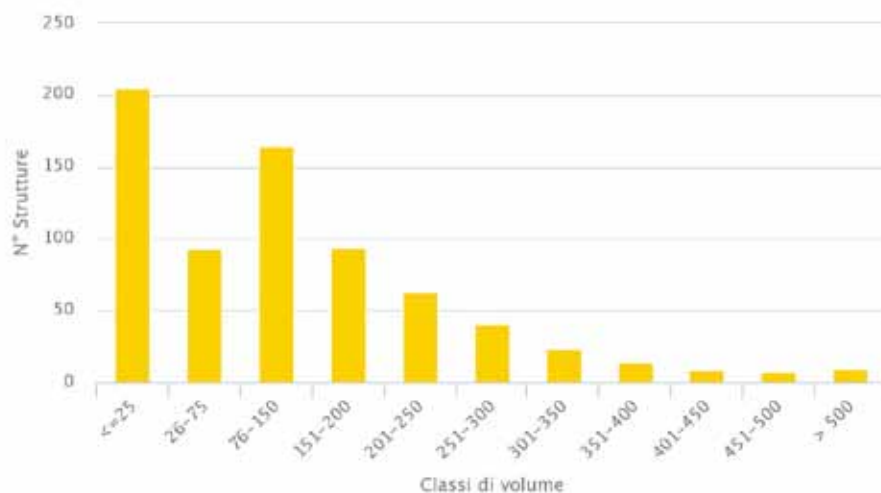
Figura 27.3. Frattura del collo del femore: distribuzione del numero di poli ospedalieri per classi di volume di attività. Italia 2015. Figure 27.3. Femoral neck fracture: distribution of the facilities by volume of activity. Italy 2015.

Data la specificità dell'intervento, la definizione dell'esposizione sulla base dei volumi del polo ospedaliero anziché dell'unità operativa non dovrebbe essere soggetta a forte misclassificazione.